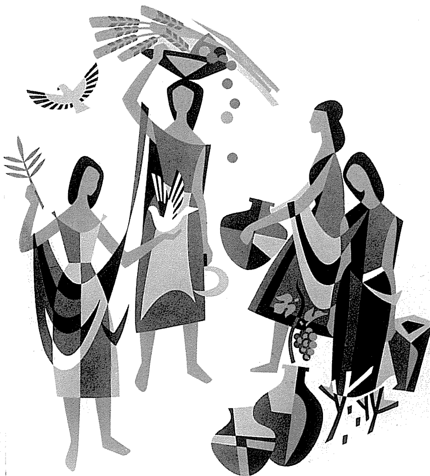
Symbole der vier Jahreszeiten an einem Privatbau in Hof, 1. Fassung, fünffarbig, 4 x 4 m.