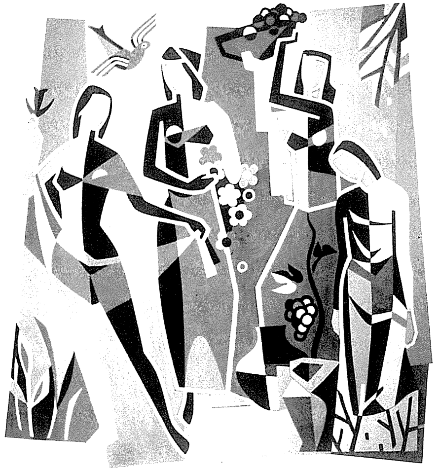
Symbole der vier Jahreszeiten an einem Privatbau in Nord- halben, 2. Fassung, sechsfarbig, 4 x 4 m.