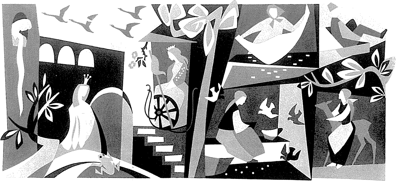
Symbole für acht Märchen für die Volksschule Nordhalben, siebenfarbig, 7 x 2,8 m.