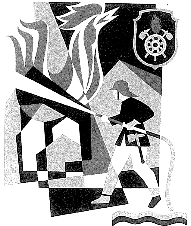
Symbol für ein Feuerwehrhaus, vierfarbig, 4 m hoch. (Man beachte die Darstellung des Feuers als „roter Hahn“)