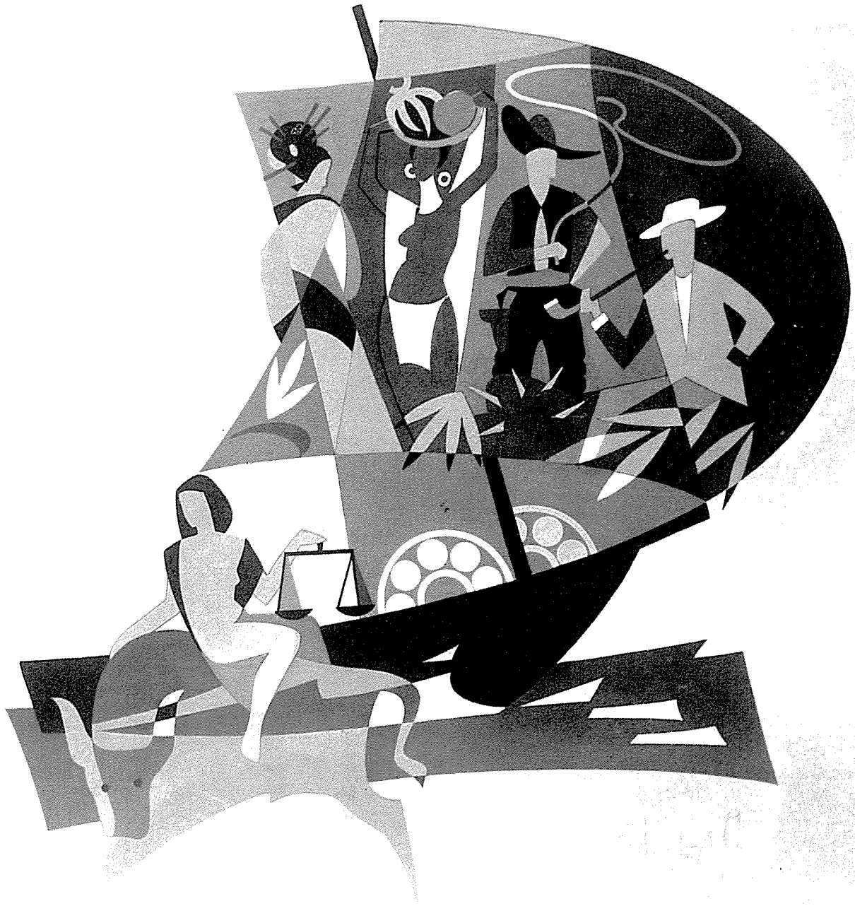
Symbolhafte Darstellung der Ausfuhr in fünf Erdteile für einen Kugellagerhändler in Schauenstein, sechsfarbig, 6 x 6 m.