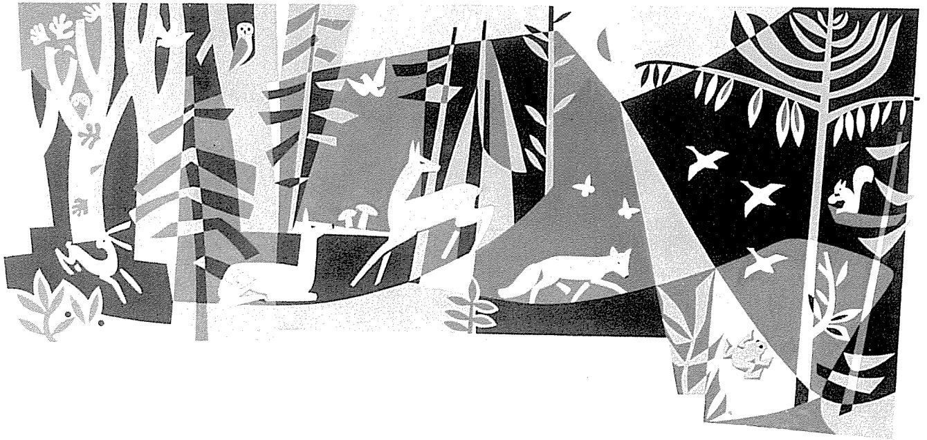
↑ Sgraffito in der Schule Nurn b. Kronach, sechsfarbig, 7 m lang.