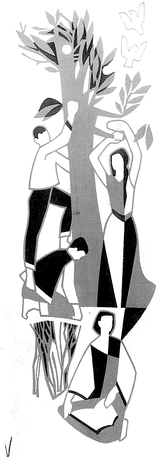
↳ Im Treppenhaus der Schule Nordhalben, vierfarbig, 6 m hoch.

einem Schriftlehrgang an der Kunstgewerbeschule Offenbach bestand), bis zum Abschluß der Lehrzeit mit „Sehr gut“, bis zum Einsatz als Maler-Kriegsberichtler 1943 und bis zum Eingang der ersten Aufträge und Anerkennungen, die seitdem nicht mehr abgerissen sind.