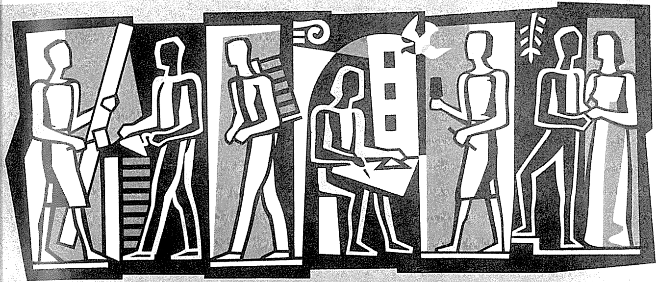
Sgraffito am Hause eines Architek- ten in Hof, sechsfarbig, 6 m lang.