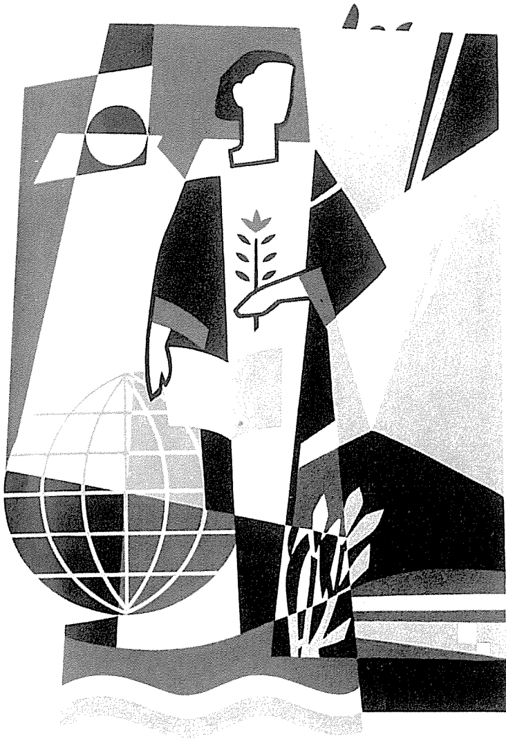
↑ Außensgraffito an der Schule Bad Steben, das Genie Humboldts darstellend, fünf- farbig, 6 m hoch.