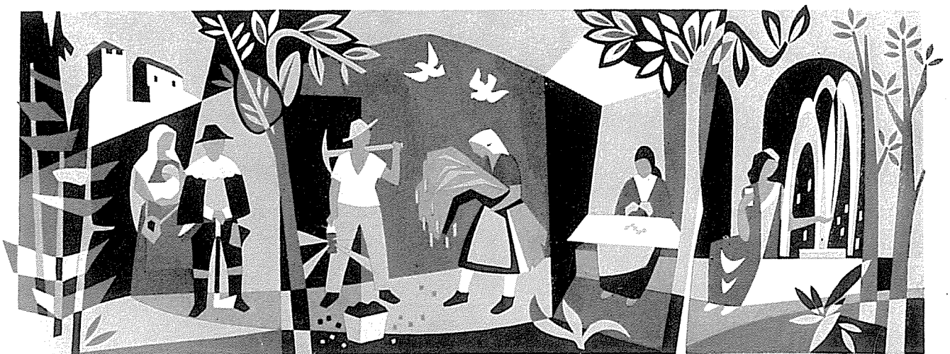
Wandsgraffito in der Schule Bad Steben, sechsfarbig, 7 x 2,3 m.