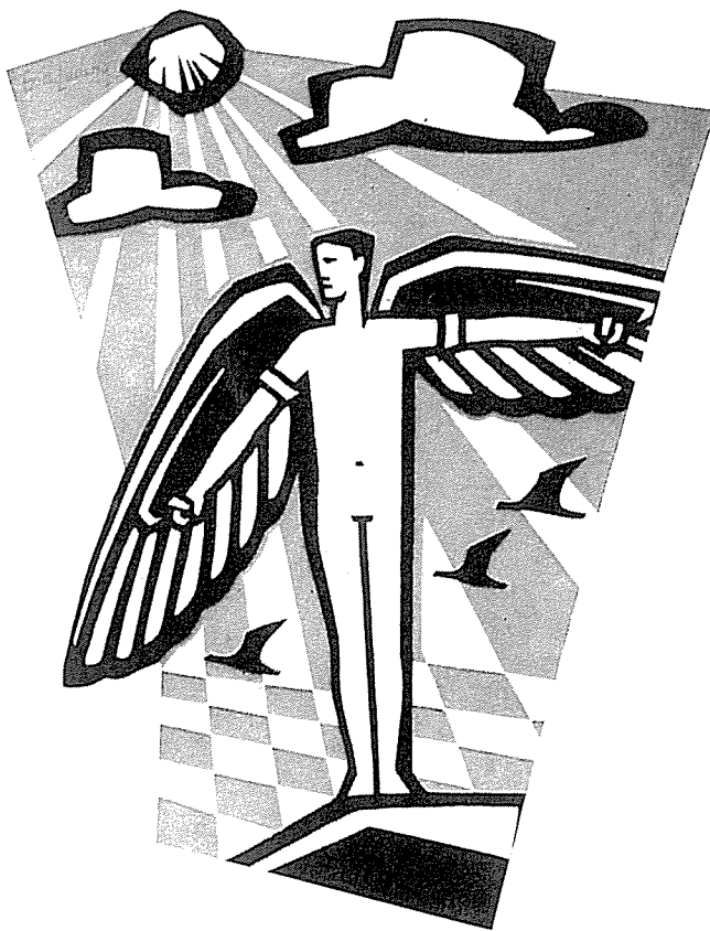
Ikarus für eine Fliegerwerkstatt in Kulmbach, vierfarbig, 4 m hoch.