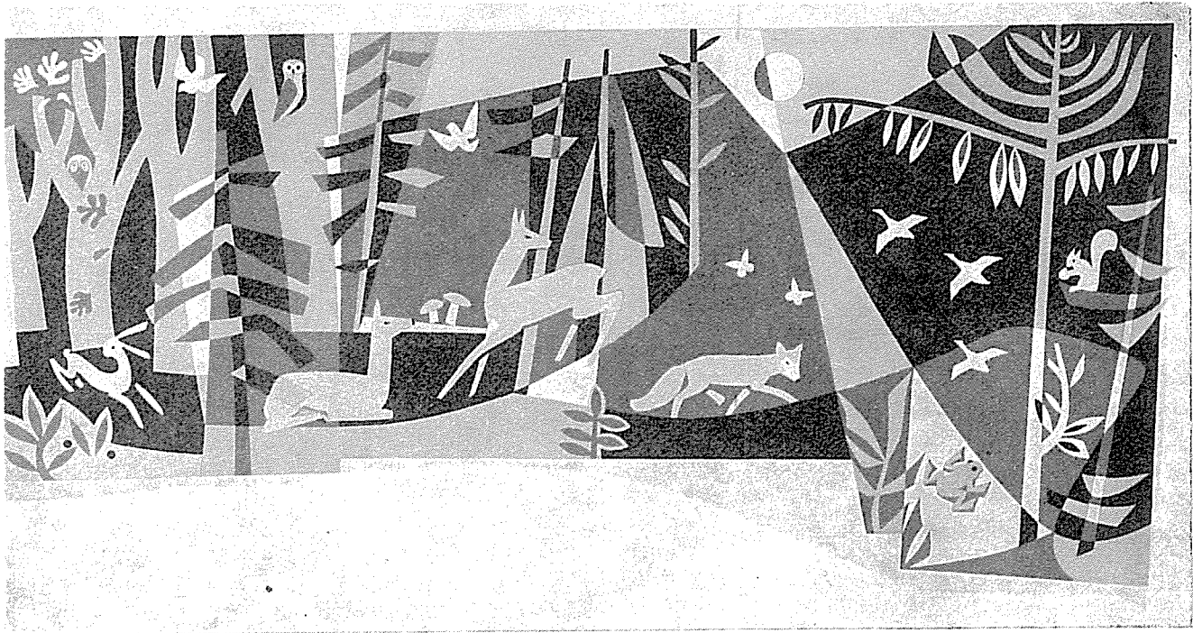
Sgraffito in der Schule Nurn bei Kronach, sechsfarbig, 7 m lang

hungrig und durstig sei, gaben sie ihm bereitwillig Weißbrot, Schokolade und Tee.