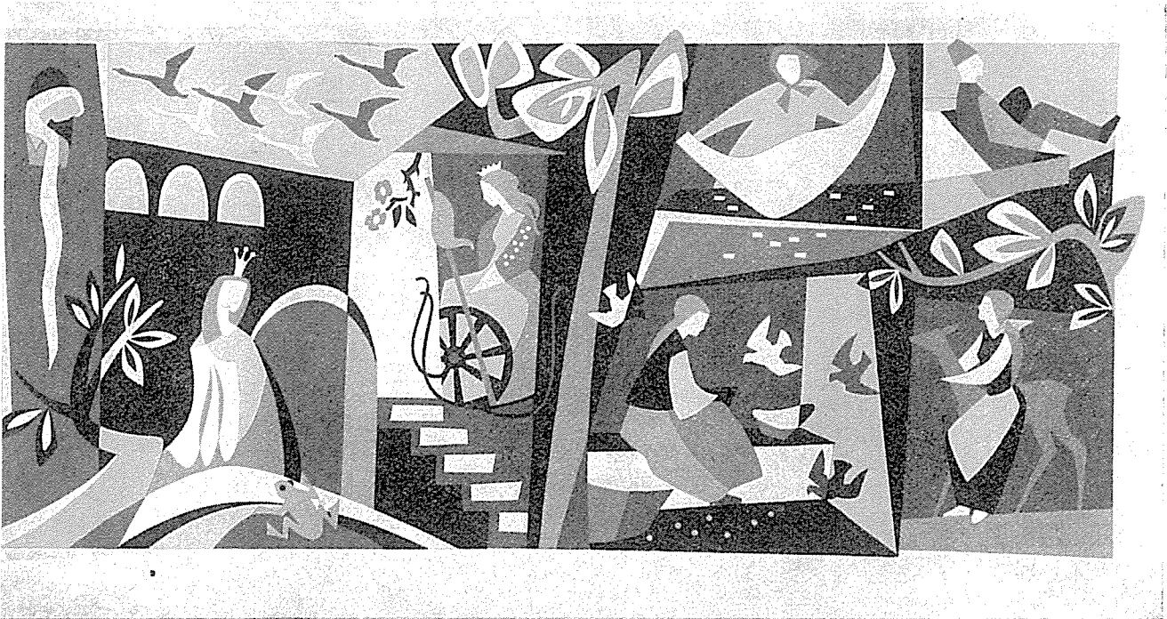
Symbole für acht Märchen für die Volksschule Nordhalben, siebenfarbig, 7 x 2,8 m

1941 rückte Ludwig zum Arbeitsdienst und anschließend zur Luftwaffe ein.