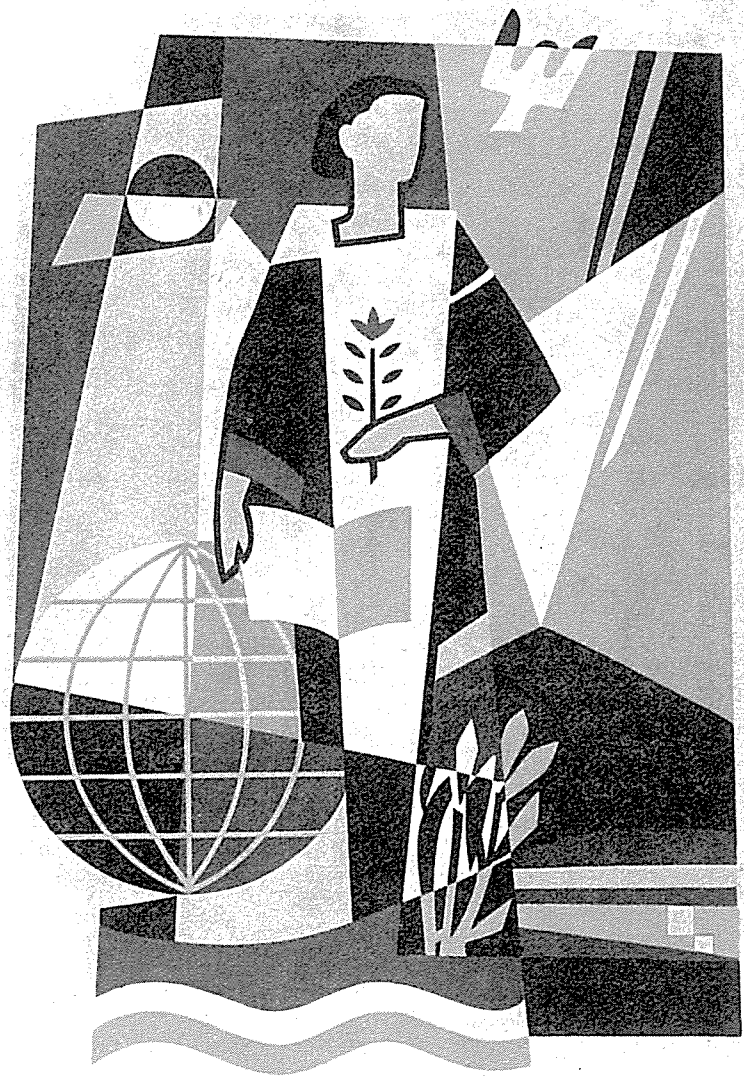
Außensgraffito in der Schule Bad Steben, das Genie Humboldts darstellend, fünffarbig, 6 m hoch