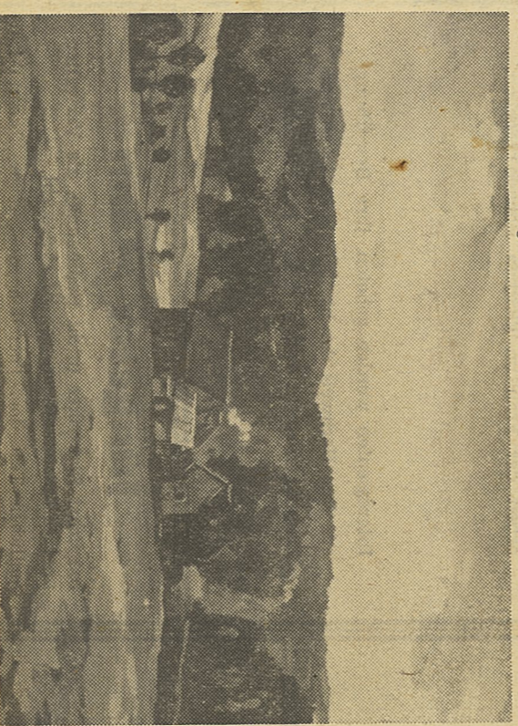
Liebe zur Heimat kennzeichnet das Gemälde „Frankenwald“

Im Mittelpunkt steht der Gelehrte, das geöffnete Buch weist auf seine schier unerlöschlichen Schriften hin. Der Zweig in der Linken ist das bescheidene Zeichen für die tiefstehenden Unterschnungen Humboldts auf botanischem Gebiet. In der Darstellung des Globus