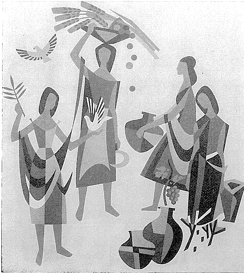
Symbole der vier Jahreszeiten an einem Privatbau in Hof, 1. Fassung, fünffarbig, 4 x 4 m

Die so entstehenden Werke sind zweidimensional; denn die geringen Dicken der Schichten - obgleich diese bei sechs übereinanderliegenden schon etwas bedeuten - schaffen noch keine dritte Dimension bzw. Plastik. Die Technik zwingt zur Einfachheit und damit Monumentalität; kleinformatische Arbeiten, noch dazu winzig in den Details, kommen nicht an. So ist es zu verstehen, daß Ludwig bei den meisten Gesichtern die Details einfach wegläßt. Er beherrscht im übrigen seine Kunst so, daß die einzelnen Werke wie aus dem Ärmel geschüttelt dastehen, aber doch ausgereift sind, während man bei Konkurrenzarbeiten oft genug peinlich berührt wird durch etwas, das man „Kunstgewerbe“ nennt. Wir selbst halten schon das Zusammenspiel von sechs Farben für riskant und am eindruckvollsten (aber auch am