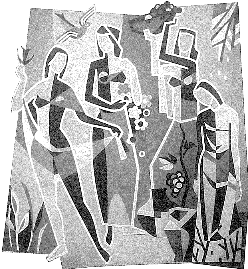
Symbole der vier Jahreszeiten an einem Privatbau in Nordhalben, 2. Fassung, sechsfarbig, 4 x 4 m

Unter dem Baum sitzt eine Figur mit Buch, welche die Wissenschaft symbolisiert.