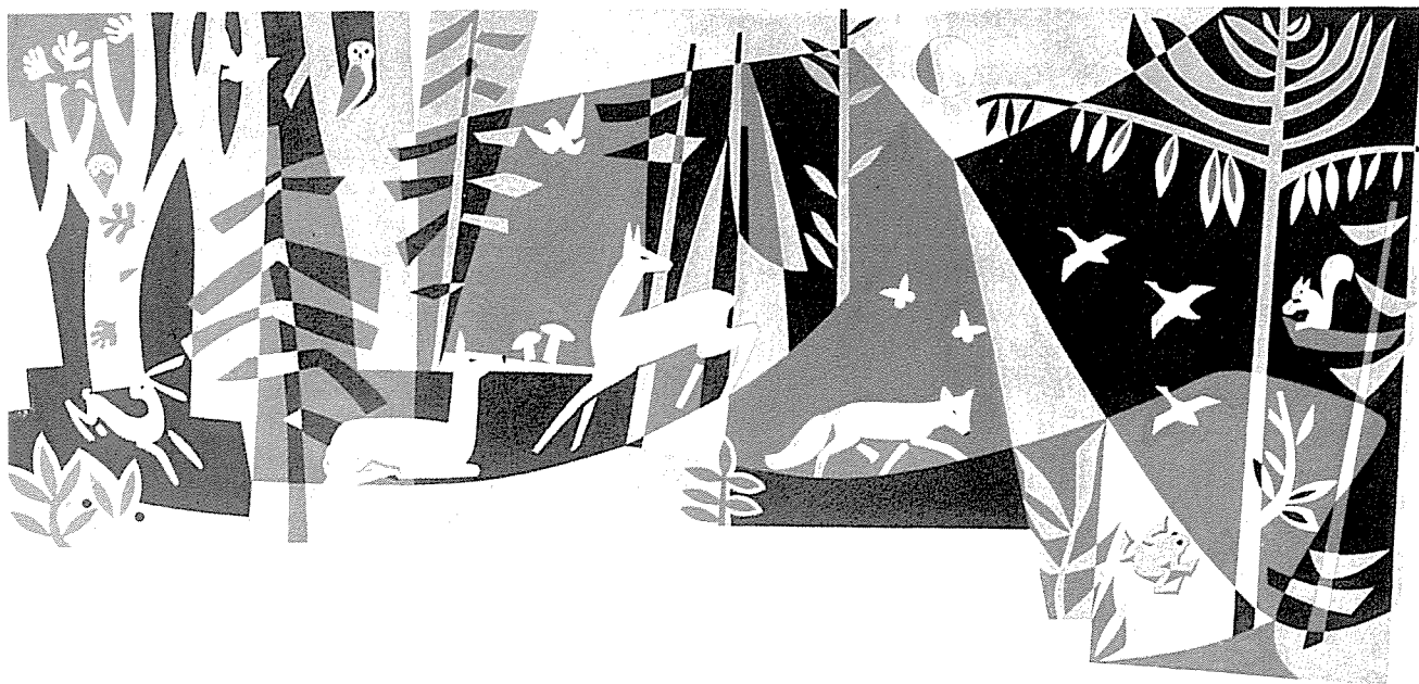
Sgraffito in der Schule Nurn bei Kronach, sechsfarbig, 7 m lang