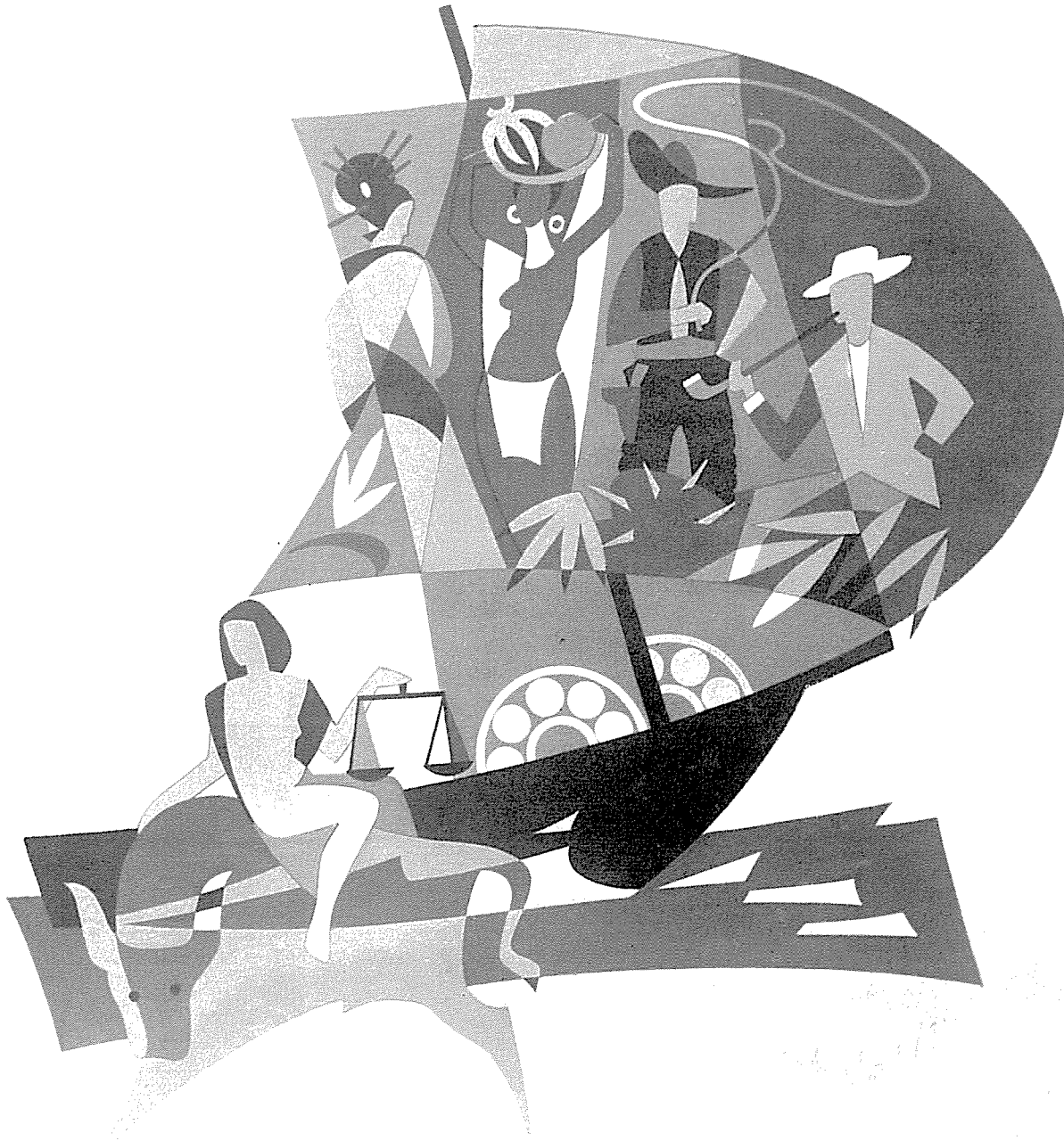
Symbolhafte Darstellung der Ausfuhr in fünf Erdteile für einen Kugellagerhändler in Schauenstein, sechsfarbig, 6 x 6 m