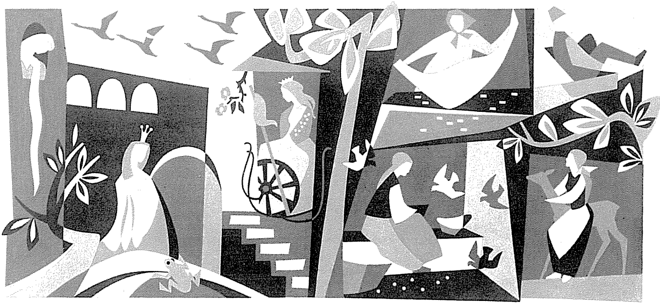
Symbole von acht Märchen für die Volksschule Nordhalben, siebenfarbig, 7 x 2,8 m